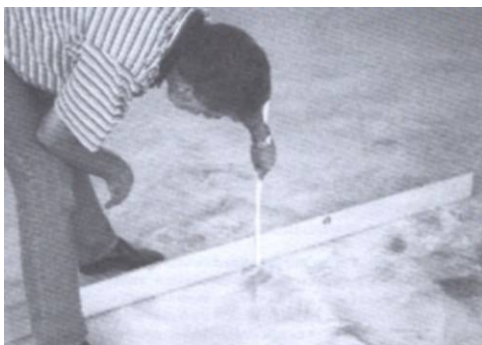
Abbildung 2 (Überprüfung der Ebenheitstoleranzen)